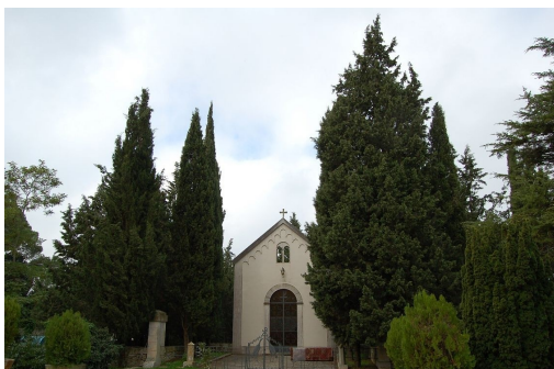
Il cimitero della comunità

Di fronte all'antica chiesina sorge la cappella cimiteriale ( costruita nel 1968 ), ove sono sepolti i primi monaci dell'abbazia.